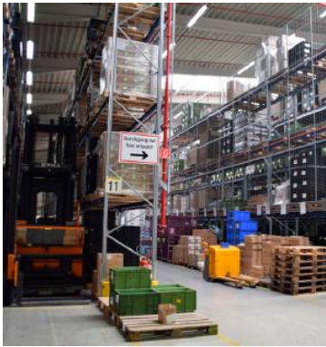
Einblick in das effizient gestaltete Hochregallagersystem